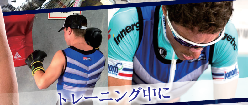
トレーニング中に